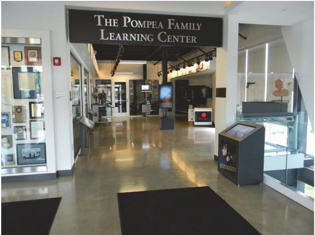
圖 3 李昌鈺鑑識科學中心鑑識科學學習中心