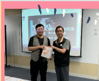
108-1學期通識教育講座