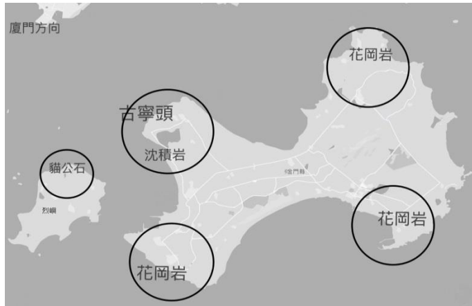
圖 1 金門地質分布圖（本研究繪製）