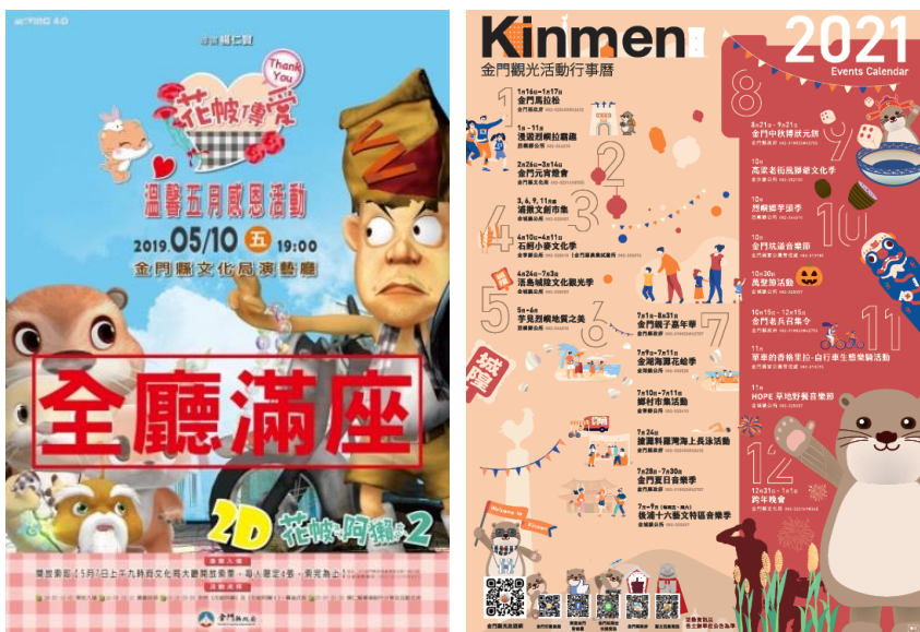
圖 3 當地文創品宣傳圖 (資料來源：本研究整理)

織品是人類的古老工藝。「織造」勞動的屬性，留下了人類重要的手藝痕跡。織品素材的特質明顯地受支配於技術和材料的限制，但織造者卻能運用組織、圖案、色彩與造形等變化，創造出織物在表面外觀性質上多樣的表情，(黃淑芳，2017)。此文獻說明地方文化與創意連結之手法，在地方截取的視覺印象引用至商品設計上，以織品來呈現。金門當地仍保有黑白格紋的育嬰布，是一種當地稱為「花帕」的生活器具，即是以古老織造技術所表現的色彩，用於當地生活上的案例，近年甚至被加上其他元素引用在電影之上(如圖 3)，並以此做更多衍生的文創商品。